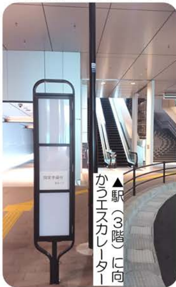
▼大井町トラックスのバス停