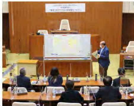
写真は、前回2022年の議会報告会のもの

今改選期、初めての品川区議会全体で行う議会報告会です。今回も委員会毎に開催されます。私の所属する区民委員会では、来年2025年に東京で行われるデフリンピック(ろう者のオリンピック)を見据え、障害者スポーツをテーマに報告と皆さんのご意見を伺います。本会議場に座れるのも魅力です。