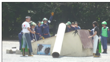
(9月9日、林試の森で行われた消防団合同訓練)