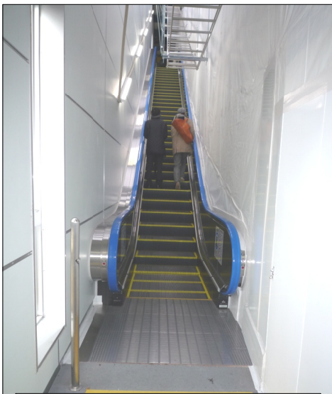
運転開始した上りエスカレーター

東急池上線五反田駅の乗降客は1日当たり11万4000人。JRとの乗り換えの階段は高低差7メートルもあります。足や目の不自由な方、小さいお子さんを抱えたお母さんから「何とかしてほしい」との声が寄せられ、中延地域で署名運動に取り組んだのは10年前。署名板の前に行列ができるほどの反響でした。「夫が心臓病を抱えながら通勤していたがああ階段がどれほど通らかったか」「疲れて帰ってきて階段を見上げるとがっくりする」「あの階段がいやで遠回りをして大井町線で帰ってきた」などなど切実な声を伝え、JR