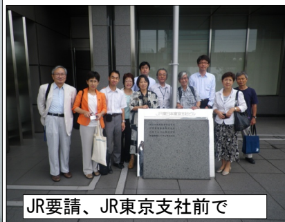
JR要請、JR東京支社前で