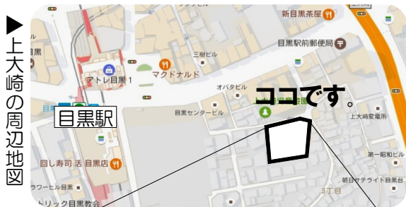
▲上大崎の周辺地図