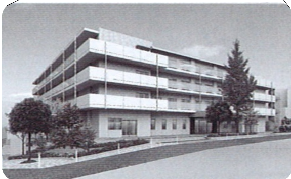
▲上大崎3丁目特養ホームのイメージ図

新たに特養ホームの計画が発表されました。南品川4丁目の国有地を社会福祉法人慈雲福祉会（愛知県）が購入し、2019年度に開設する予定です。特養は全室個室ユニット型で81人分、ショートステイが9人分整備される予定です。