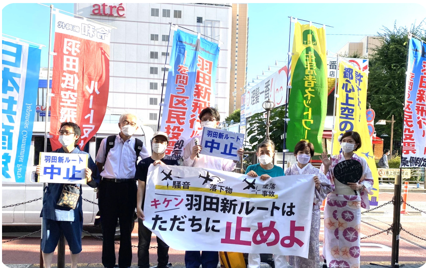
当日は浴衣や甚平と夏らしい格好などで宣伝しました。

7月17日、大井町駅前にて、「羽田問題議員連盟しながわ」（以下、羽田議連）と羽田新ルート問題に取り組む区内住民団体の共同で、新ルートの撤回を求める街頭宣伝を行いました。 超党派の議員と住民で リレートーク