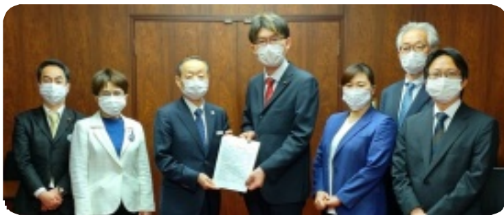
▲3月26日、品川区長に新型コロナウイルス感染症対策への第5回緊急要望を提出。内容はコロナ感染第4波を防ぐため、大規模なPCR検査の実施、事業所支援です。副区長等が対応。区議団は「ワクチン頼みにせず、大規模な検査や補償など十分な体制を同時平行に実施することが重要」と強調しました。