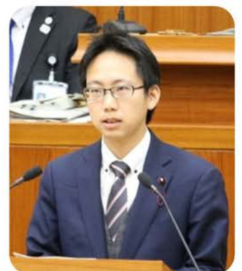
▲区議補選により質問時間が5分増えました

避難所環境の改善へ以下の提案をしました。①食事スペースを個人スペースと別に設け寝食の分離、②ベッドの使用を当たり前に、③女性トイレの数を男性の3倍に。