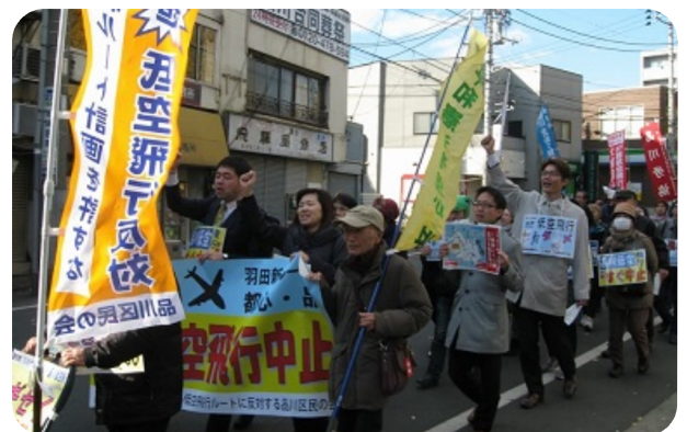
▲12月10日、第12回目の羽田新ルートに反対するパレードが行われ超党派の参加で125名に。計画見直しを求める声広がっています。