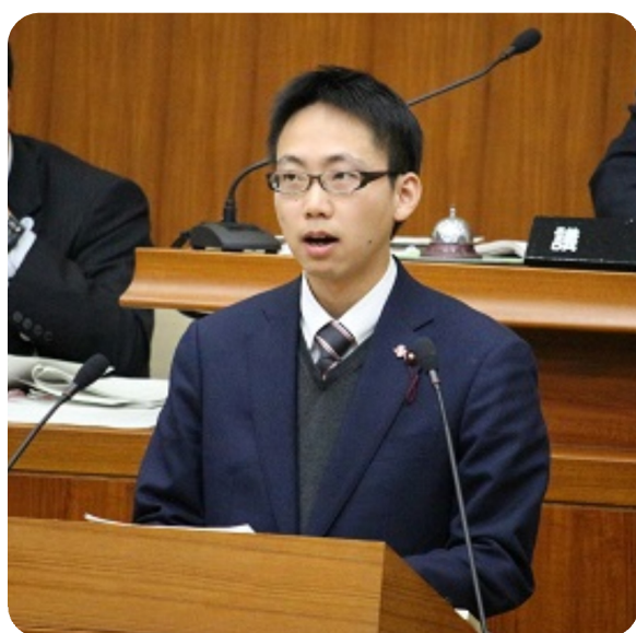
▲共産党区議団を代表し一般質問