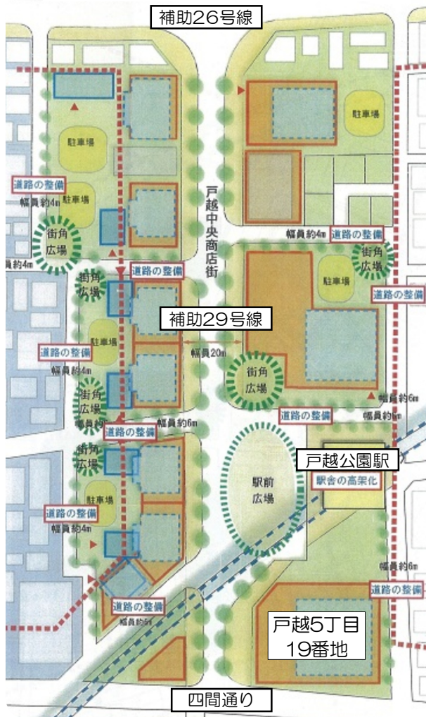
戸越公園駅周辺再開発イメージ平面図

まちのよさを活かしたまちづくりを 地元では戸越公園駅周辺まちづくり情報発信会が行われてい ます。画に疑念を抱いています。 その中で戸越5丁目19番地の 隣地の方からは「超高層が建つ たら影響が大きい。地権者のた めにやるという説明しかない。 小さな土地で無理してやる必要 あるのか」という声や近隣の方 からは「再開発によって寝泊り で帰ってくるだけのまちになっ ます。画に疑念を抱いています。 超高層再開発ばかりではどこ も同じ町になってしまいます。 この地域のよさは商店街があ り親しみやすく顔の見える付き 合いができることだと思います。 これまで築いてきたまちのよ さを活かしたまちづくりこそ必 要です。