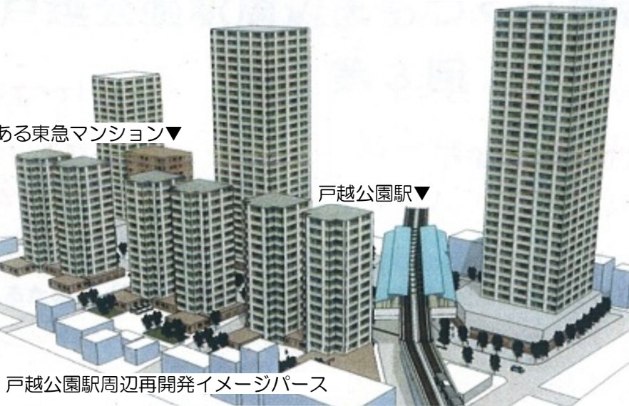
戸越公園駅周辺再開発イメージパース