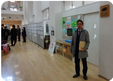
▲文教委員会で杉並区の学校にコミュニティスクールの話聞くために視察に行ってきました。現教育長が以前いた学校のように品川と同じような仕組みでしたが丁寧にやっている印象を受けました。

実際に実行しなくても、検挙が可能のため抗議活動などが処罰される可能性もあり、治安維持法につながるものです。