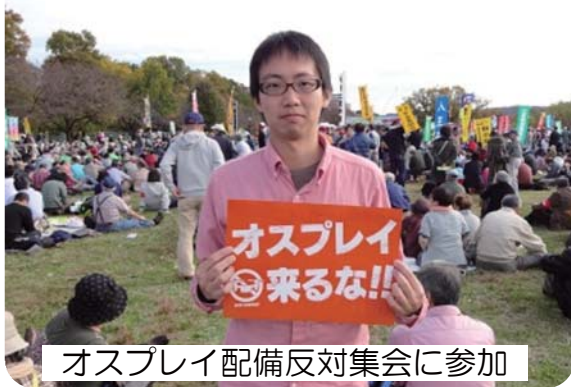
オスプレイ配備反対集会に参加