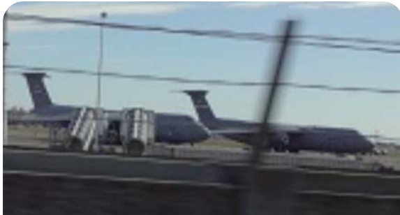
横田基地を視察。現地の方に説明を受けオスプレイ配備に向け施設整備も行われているとのことでした。

戦争法廃止や沖縄新基地建設反対のたたかいとも連帯し配備撤回へ運動を力強く進めようと決意を固めました。その後デモ行進も実施。