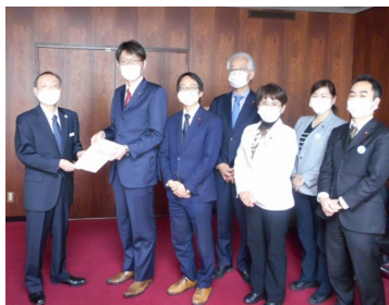
579項目の予算要望を品川区に提出しました(12月)