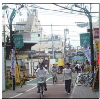
商店街はどこも厳しい経営