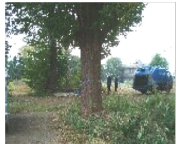
上の写真は建設予定地内部です。大木のあるいいところです。

なお、H26年度にできる杜松小学校跡地の29床の特養ホームは、H25年度に工事に入ります。そして、平塚橋会館建替えによってできる特養ホーム(100床)は、H25年度に解体工事と実施設計を行って、H27年度の完成します。区民と一緒に署名運動に取り組み、区議会の中でも積極的に取り上げて実現を求めてきただけにとてもうれし、運動すれば大きな力になると実感します。引き続き頑張ります。