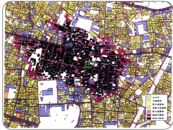
豊町1丁目、29号線整備前、1491棟が延焼。左下の広場は戸越公園。