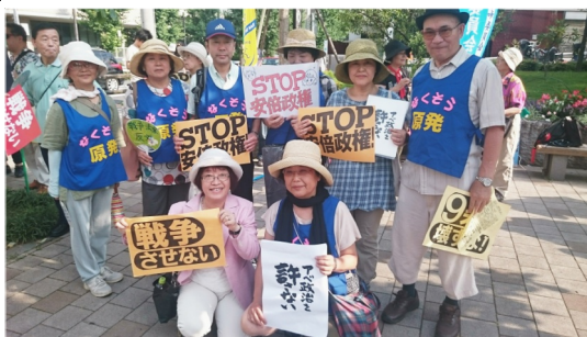
小山・後地の皆さんと品川平和パレード