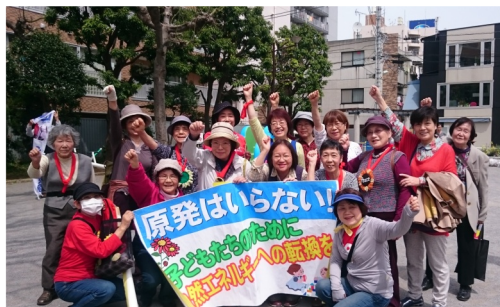
新日本婦人の会 婦人民主クラブ