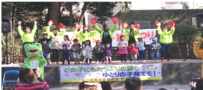
保育園の数も質も大事 保育・給食まつり

火災が起これば道路を超えて街が燃えてしまう。防災の為というなら、住宅が倒れない耐震化、通電火災を防ぐ感震ブレーカー設置にこそ税金投入を！道路問題品川連絡会のアピール