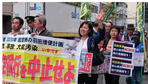
低空飛行ルート計画に反対する品川区民の会