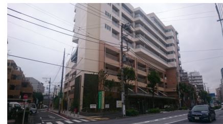
署名運動が力に 平塚橋特養ホーム 新設 上大崎建設中、南品川にも