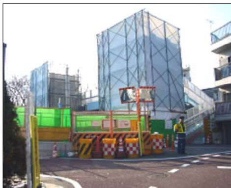
代替設備（歩道橋・エレベーター）

地下化工事にもかかわらず、この地域は鉄道が地下に潜りきらず掘割となり大切な生活道路が閉鎖となりました。線路と住宅の間に新たにできた代替道路の危険性。掘割から発生する鉄道騒音（特に急行通過時）。線路をまたぐ歩道橋の足音が響く騒音。どれも新たに発生した公害です。対策を求め、切実な請願は、26日（月）午後4時から建設委員会でも審査されます。当日午前10時20分頃に建設委員会メンバーが現地を視察します。直接実態を訴えてほしいです。