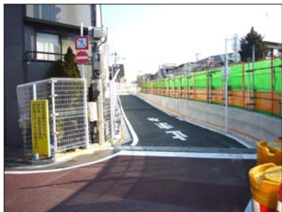
線路と住宅の間にできた代替道路

地下化工事にもかかわらず、この地域は鉄道が地下に潜りきらず掘割となり大切な生活道路が閉鎖となりました。線路と住宅の間に新たにできた代替道路の危険性。掘割から発生する鉄道騒音（特に急行通過時）。線路をまたぐ歩道橋の足音が響く騒音。どれも新たに発生した公害です。対策を求め、切実な請願は、26日（月）午後4時から建設委員会でも審査されます。当日午前10時20分頃に建設委員会メンバーが現地を視察します。直接実態を訴えてほしいです。