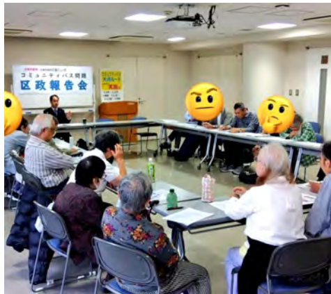
11/3大崎第二区民集会所にて。

大崎ルートは区役所を通る唯一のルート案(裏面にルート図)です。区はコミバス運行検討の結果、この大崎と荏原、大井の