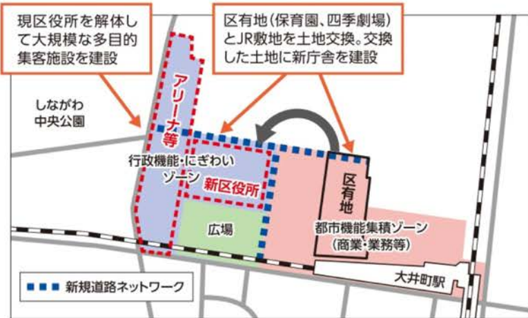
(区の資料から共産党区議団作成)