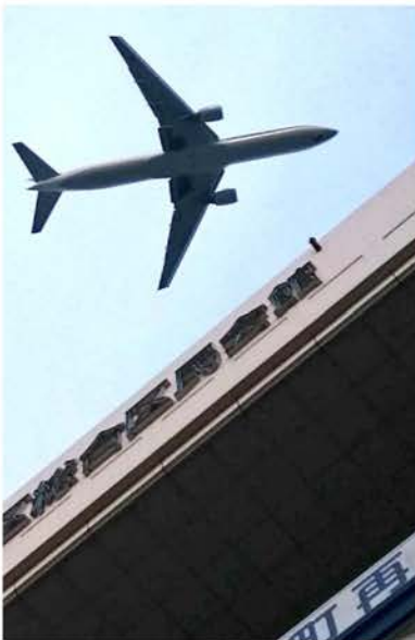
きゅりあんを通過する航空機