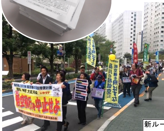
昨年10月に大崎～五反田駅で行われた住民の会によるデモ行進。