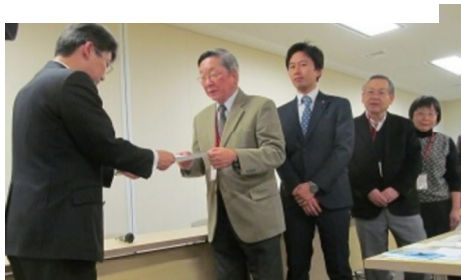
2月9日、品川の住民団体を含めた都内10区から50人が参加し、東京都の秘書課長に要請書を提出。都民ファーストを言うなら知事は新ルートに反対するよう求めました。

アンケートは、返信用封筒をつけ各戸に配布する形式。前回2014年に実施した第10回区民アンケートは1106人でしたので、この問題への区民の関心の高さが示されています。結果も、80%が「反対」と答え、圧倒的多数の区民の計画への反対傾向が明瞭となりました（下表）。また、墜落事故への不安も強い事も特徴です。計画は撤回しかありません！