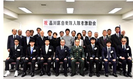
2015年度「激励会」の様子 (区HPより)

共産党が議会で激励会について「区長が激励し自衛隊に送った品川の若者が外国で殺し殺される武力行使がすぐそこまで迫っている、反対しないのか」と迫ると、区長は「自衛隊は現在、武器使用の任務を付与され南スーダンへ派遣。現地では政府軍・反政府軍による戦闘が頻発し、いつ「殺し殺される」最悪の事態が発生してもおかしくない状況です。」