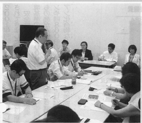
道路計画による住民追いだしに批判の声が相次いだ懇談＝2日、千代田区