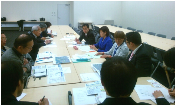
参議院会館にて。国交省航空局の航空ネットワーク部、安全部の課長級が対応。

新ルート案は、夏場など、年間4割を占める南風時に午後3時から7時まで、一時間あたり44機というすさまじいペースで品川上空を通過する内容（下イメージ図）。落下物の危険に、大気汚染。大井町上空で80デシベルとされる騒音は、聴覚障害者から「音を頼りに歩く我々にとっては死活問題だ」と心配の声も出されています。（裏面へ）