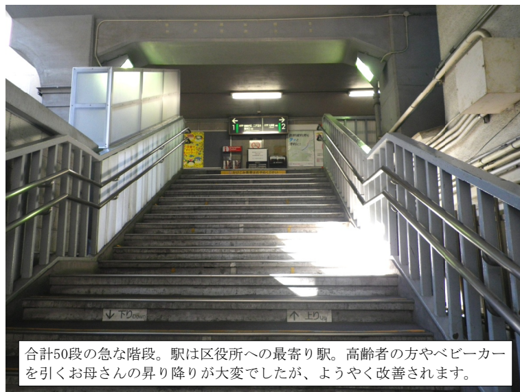
合計50段の急な階段。駅は区役所への最寄り駅。高齢者の方やベビーカーを引くお母さんの昇り降りが大変でしたが、ようやく改善されます。

区内の駅で唯一、エレベーターもエスカレーターも未整備だった東急大井町線・下神明駅が待望の工事着手することになりました。2月下旬に近隣説明会、3月下旬から工事着手へ。完了は3年後ですが、進捗に伴い順次、共用開始される予定です。