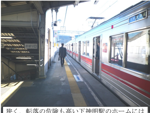
狭く、転落の危険も高い下神明駅のホームにはホームドアの設置も必要です

(表面続き) また、今回の改修にあわせて、ホーム転落事故防止の可動柵の設置を要望。区内在住の視覚障害の方からも要望が出ていたもので、実際に、ドアが設置された駅では転落事故は起きていません。区から「検討を今後していく予定。順次実施していく段階に入る」との答弁。後日、新年度予算で終着駅の大井町駅に設置される方向も打ち出されました。1月には目白駅で死亡事故が起きるなど、命を守る対策はまったなし。下神明駅も設置が必要です。